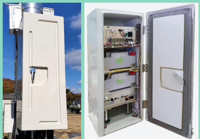
※みちびき受信機は古野電気株式会社の製品を利用しています。