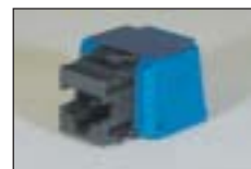
Cat.6 RJ45 モジュラー ジャック (KRONE 端子)