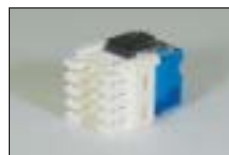
Cat.5e RJ45 モジュラー ジャック (KRONE 端子)

RJ45 モジュラージャック (KRONE 端子) が搭載可 モジュラーの色は白、黒、赤、青の4色が選べます