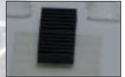
スリーブホルダー