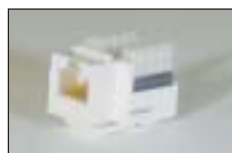
Cat.5e RJ45 モジュラー ジャック (110 端子)