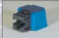
Cat.6 RJ45 モジュラー ジャック (KRONE 端子)