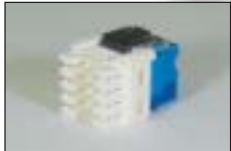
Cat.5e RJ45 モジュラー ジャック (KRONE 端子)