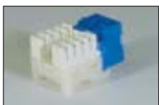
Cat.5e RJ45 モジュラー ジャック (KRONE 端子)