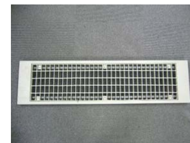
(鉄製二重床パネル)