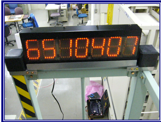
プラットフォーム取り付け例